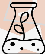
Echelle de pH

Ingrédients / INCI : AQUA, ALCOHOL DENAT., DIMETHYL GLUTARATE, LAURETH-7, SODIUM LAURETH SULFATE, GLYCERIN, SODIUM BENZOATE, PARFUM, DIMETHYL SUC-CINATE, DIMETHYL ADIPATE, SALICYLIC ACID, ALOE BARBADENSIS LEAF EXTRACT, PROPYLENE GLYCOL, CITRIC ACID, POLYSORBATE 20, PEG-35 CASTOR OIL, PEG-40 HYDROGENATED CASTOR OIL, TOCOPHERYL ACETATE, LIMONENE, LINALOOL, BENZYL SALICYLATE, CITRONELLOL, CITRAL, GERANIOL